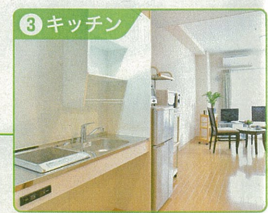
③ キッチン 安全性・使い勝手を考慮したIHクッキングヒーターを採用。車椅子対応のスペースを確保。