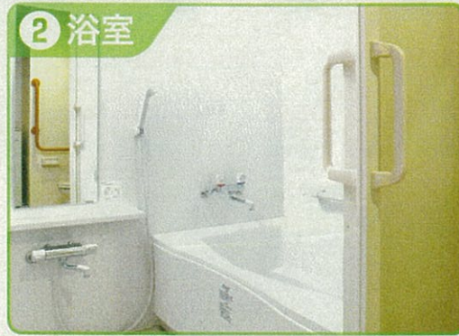
② 浴室 浴槽は、一般賃貸住宅よりも広いタイプを採用（約2.5㎡と広々） ※全室緊急ボタン設置