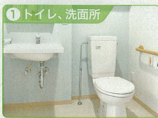
① トイレ、洗面所 ゆとりある完全バリアフリー設計で車椅子の方も安心 ※全室緊急ボタン設置

水洗トイレ（手すり付）、浴室（シャワー・手すり付）、給湯設備、洗濯機置場、洗面化粧台、緊急通報ボタン（居室、浴室、トイレの3カ所）、インターホン、キッチン（IHコンロ）、玄関ベンチ、下駄箱、クローゼット、エアコン、スプリンクラー