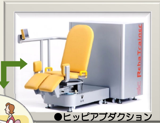
●ヒップアブダクション