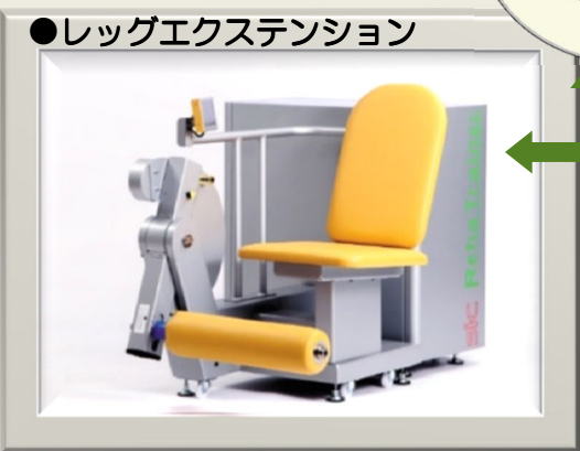
●レッグエクステンション