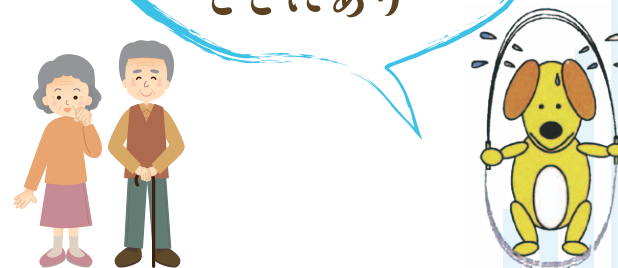
マスコットキャラクター ライムくん