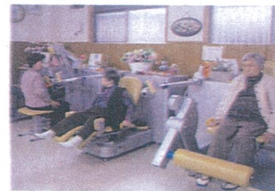
○リハトレーナー(コンピューター制御システム導入機) 利用者様各自の最適な負荷で効果的なトレーニングを行っております。