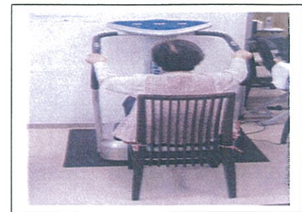
○認知症・パーキンソン病に非常に効果的な運動