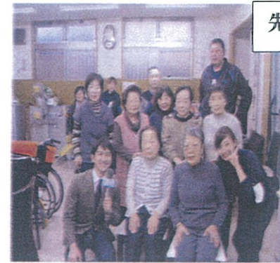
先日「テレビ朝日」情報番組グットモーニングで渋谷館が放映されました