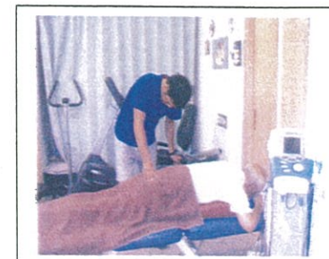
運動後のマッサージ